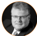
Andreas Borgmann Ferdinand Bilstein GmbH + Co. KG