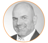
Ralph Meyer Schwarz IT KG