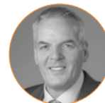
Hans-Rainer Hesler Vogelsang GmbH & Co.KG