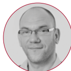
Stefan Fisahn Perfion GmbH