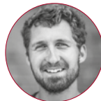
Patrick Zackert Otto GmbH & Co KG