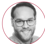
Fabrizio Maria Gambato real media technic Staudacher GmbH