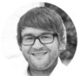
André Schneider Festool GmbH