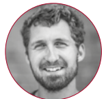
Patrick Zackert Otto GmbH & Co KG