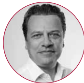
Max Bense collectAI GmbH