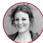
Tina Groll ZEIT ONLINE