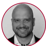
Janusz Buttgerit Cash Payment Solutions GmbH