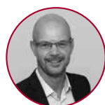
Lutz Leda LEDA Law