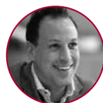
Marcel Frost eprimo GmbH